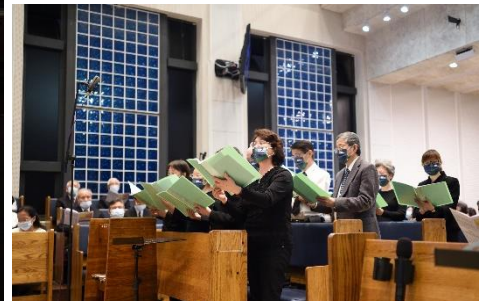
仁愛教會聖歌隊獻詩