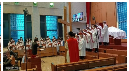
聖歌隊、少年團契、青年團契 聯合獻工