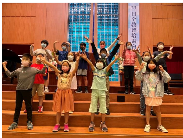
教會教育事工主日 兒童主日學獻唱讚美組曲