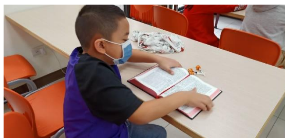
『我長大就看得懂了...』