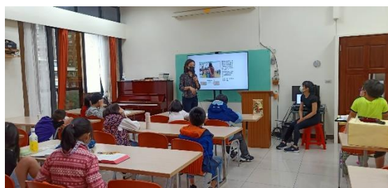
小朋友認真聽故事