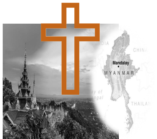
緬甸(曼德勒)成立教育中心

過去我們已經被上帝拯救，嚐過福音的好處，但現在的我們是否仍需要上帝繼續的拯救，這拯救是包括自己的，也是我們的家庭、更是我們所身處的教會信仰群體，我相信沒有一人敢說，我已經完全了，我們都需要上帝繼續的拯救，求主幫助我們了解，現在的我為什麼會在這裏，未來我要往那裏去。上帝已經揀選我們成為祂的兒女，成為基督徒，但是我們是否有在上帝拯救的大計劃中呢？因為上帝拯救的大計劃，唯有通過愛與受苦，才能成為盼望的記號不是嗎？！願我們都成為主耶穌的見證人，讓我們能夠對我們的下一代說『上帝差我在你們以先來』，成為述說主榮耀的福音使者。