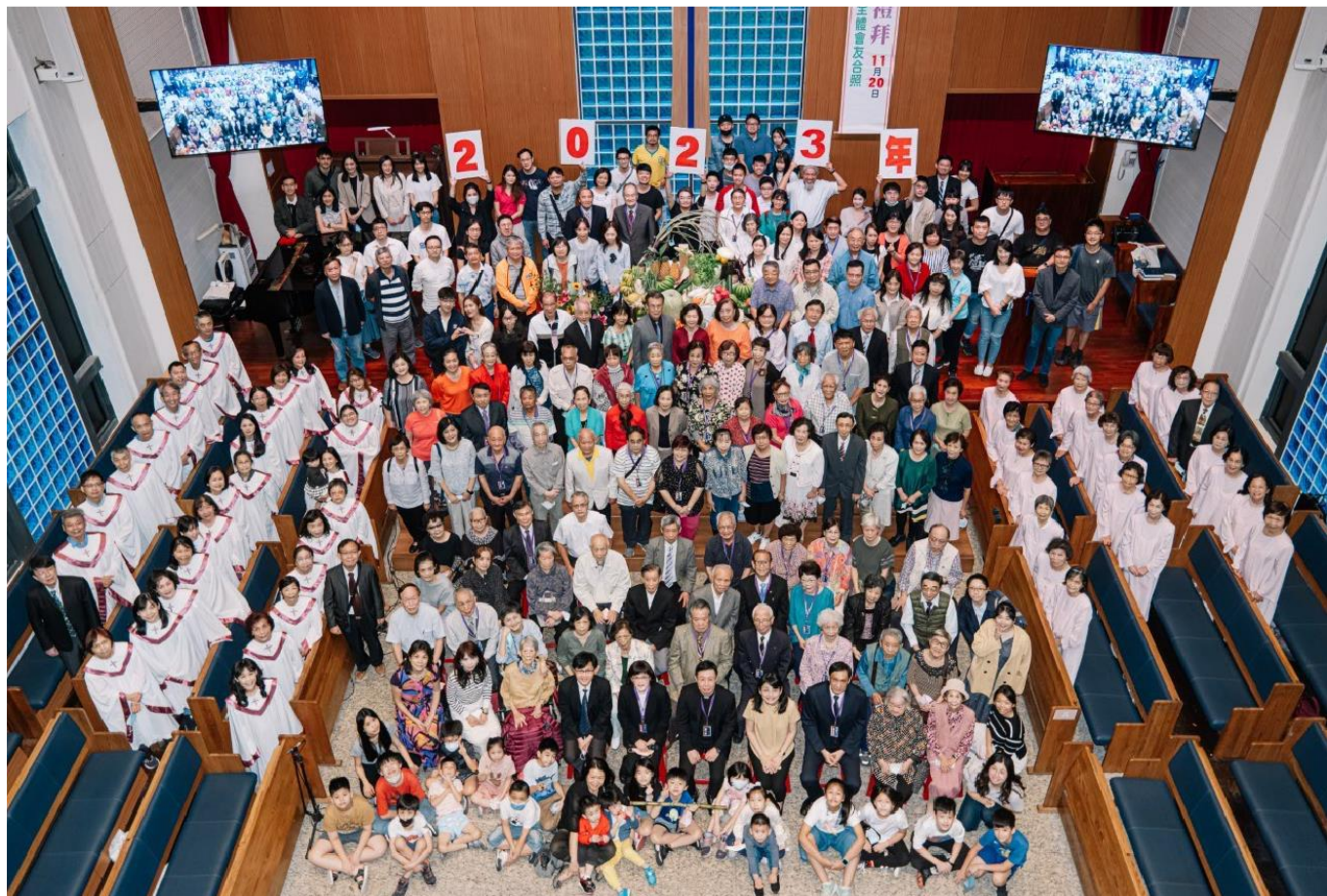
2023 年主題 跟隨耶穌 連結與更新