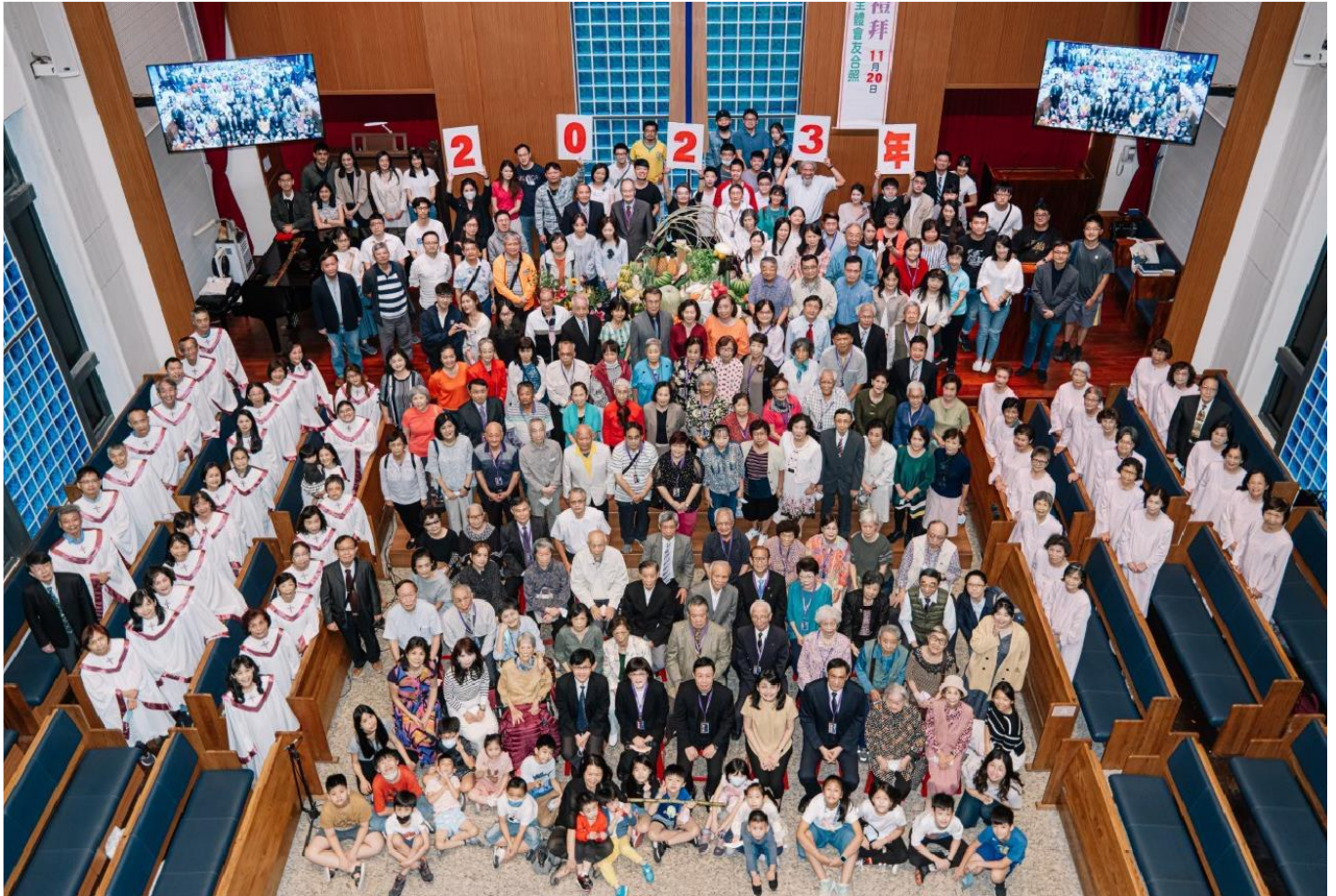
2023 年主題 跟隨耶穌 連結與更新