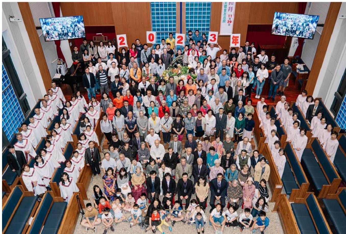
2023 年主題 跟隨耶穌 連結與更新