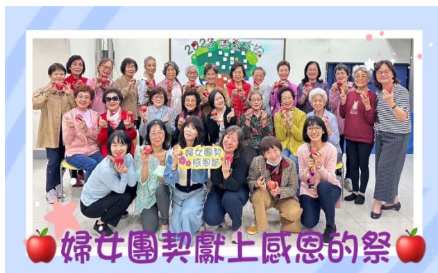
婦女團契獻上感恩的祭

2.11/28 李謀卿執事分享：彩色的人生，馬偕博士來台宣教 150 周年的宣傳海報「馬偕的畫像」就是其所畫，上帝賜他繪畫及設計的恩賜，將聖經的故事栩栩如生展現在圖畫中，非常的精彩，來享受他的創作。